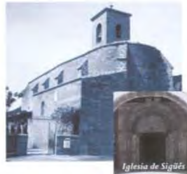
Iglesia de Sigüés

El Camino de Santiago a su paso por Aragón está amenazado por el proyecto de recrecimiento del embalse de Yesa. Las afecciones se concretan en 22 kilómetros de esta ruta de peregrinación, la iglesia de San Esteban (siglo XII), el antiguo Hospital de Peregrinos de Santa Ana y numerosas casonas en Sigüés, las ermitas románicas de San Jacobo y San Juan de Maltray, ambas en Ruesta, la ermita de San Pedro en Artieda y varias necrópolis y otros restos arqueológicos de gran valor.