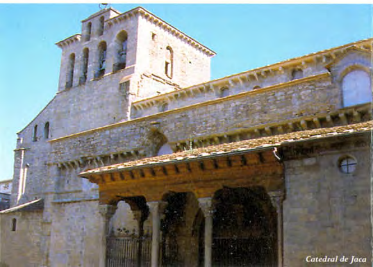
Catedral de Jaca

The Santiago Pilgrimage Route is a World Heritage Site and should be conserved.