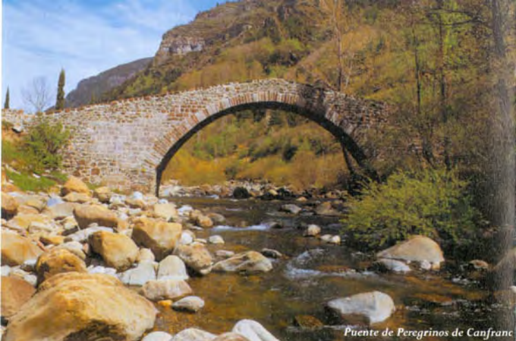
Puente de Peregrinos de Canfranc

El camino de Santiago es Patrimonio Mundial de la Humanidad declarado por la Unesco. Entre todos hay que protegerlo.