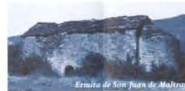
Ermita de San Juan de Maltray

Le parcours aragonais du Chemin de Saint Jacques de Compostelle commence au Somport, où l'on trouve les ruines de l'Hôpital de Santa Cristina, et il s'étend tout au long de la vallée de l'Aragón. Exemple de son importance sont les plus remarquables sites de ce parcours: le sanctuaire de Santa María de Iguácel, dans La Garcipollera, l'ermitage de San Adrián de Sasabe, à Borau, la cathédrale de Jaca –la première construction romane, modèle architectonique à l'époque–, l'église de