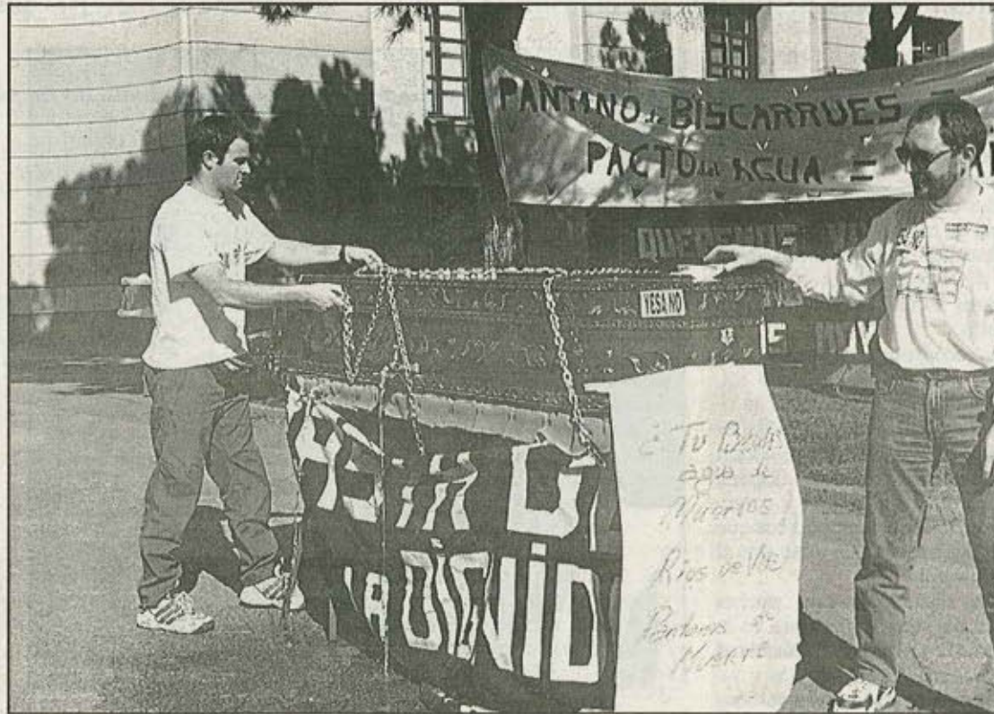
Acto de vecinos de los pueblos afectados por el recrecimiento de Yesa ante el Ministerio de Medio Ambiente, ayer en Madrid

Una veintena de personas, entre ellas representantes de la Asociación «Río Aragón» y vecinos de Artieda, Sigüés y Mianos, se encadenaron ayer junto a un ataúd, también provisto de cadenas y conteniendo 150 litros de agua, del que colgaba un cartel en el que se podía leer «¿Tú beberías