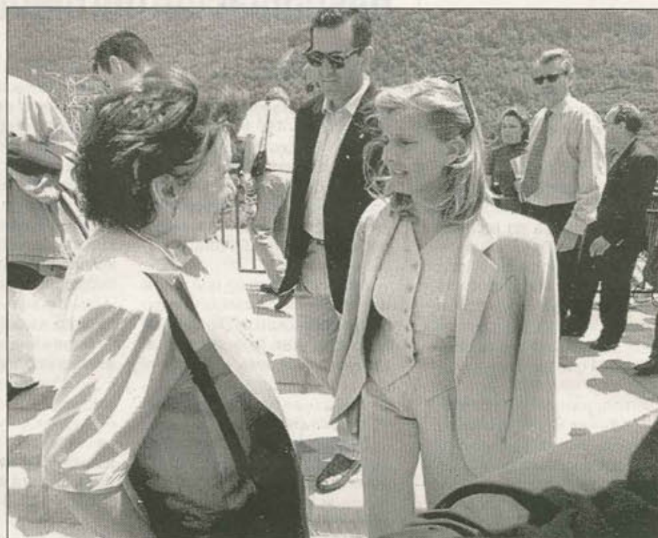
Concentración de ayer en Zaragoza ante la sede de la CHE. A la derecha, una de las visitas de la ministra Tocino al Alto Aragón.

En Madrid se construyó una presa de cartón a las puertas del Ministerio