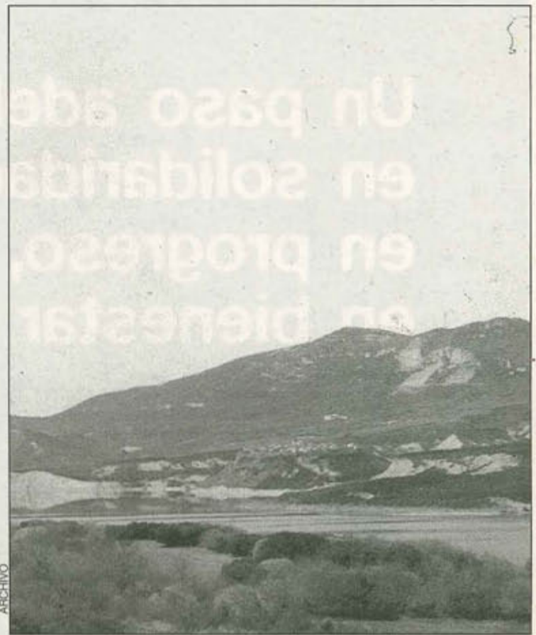
Embalse de Yesa.