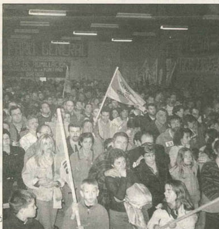
Público asistente al concierto del sábado.