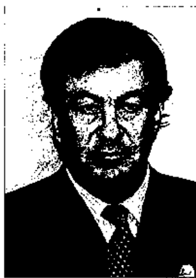
Francisco Álvarez Cascos.

También Matas mostró su confianza en la gestión del secretario