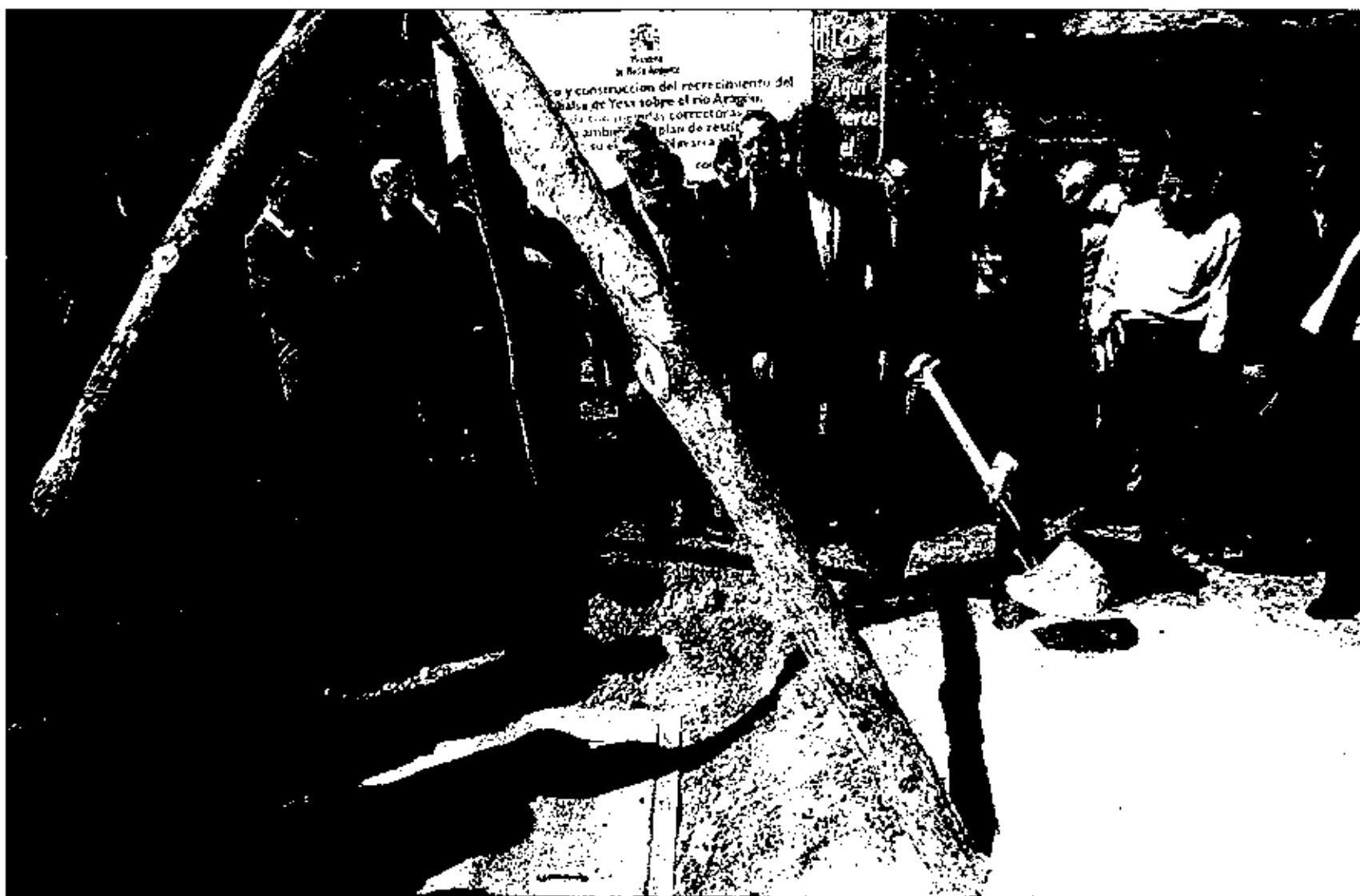
►► El ministro de Medio Ambiente, Jaime Matas, colocando la primera piedra del recrecimiento de Yesa.