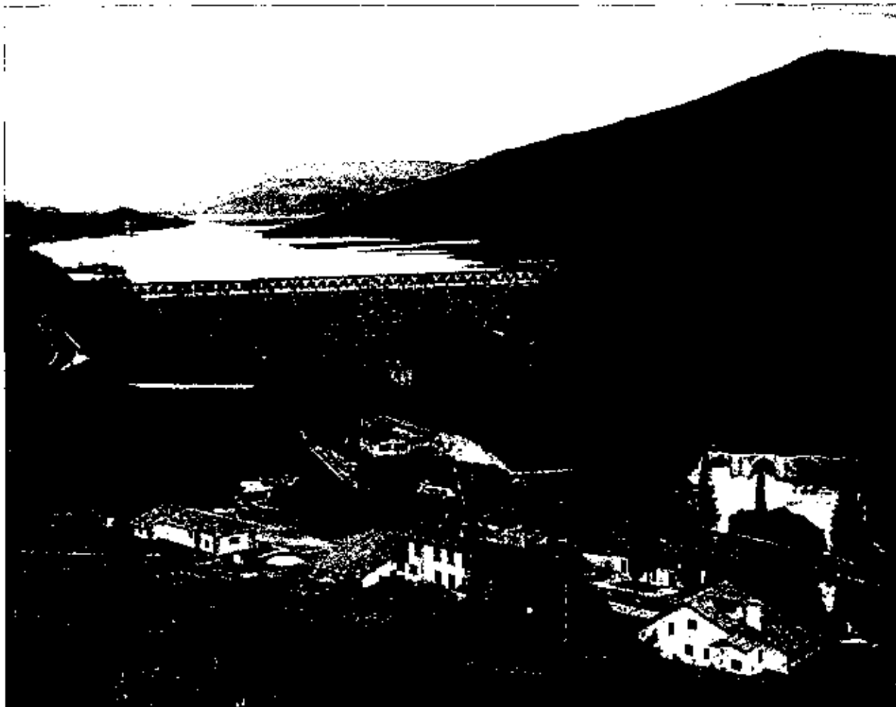
► Vista del pantano de Yesa, objeto de polémica.