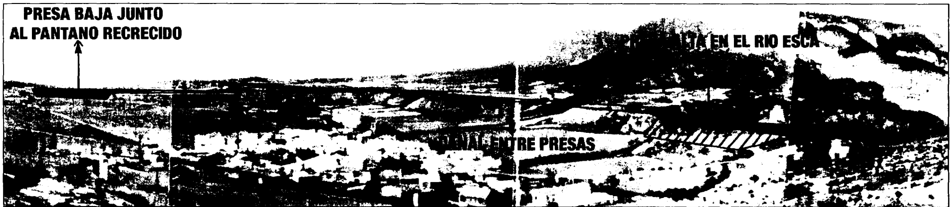
La mejor de las tres alternativas, contempla la construcción de dos presas en el cauce del río Escá y un canal que uniría ambas