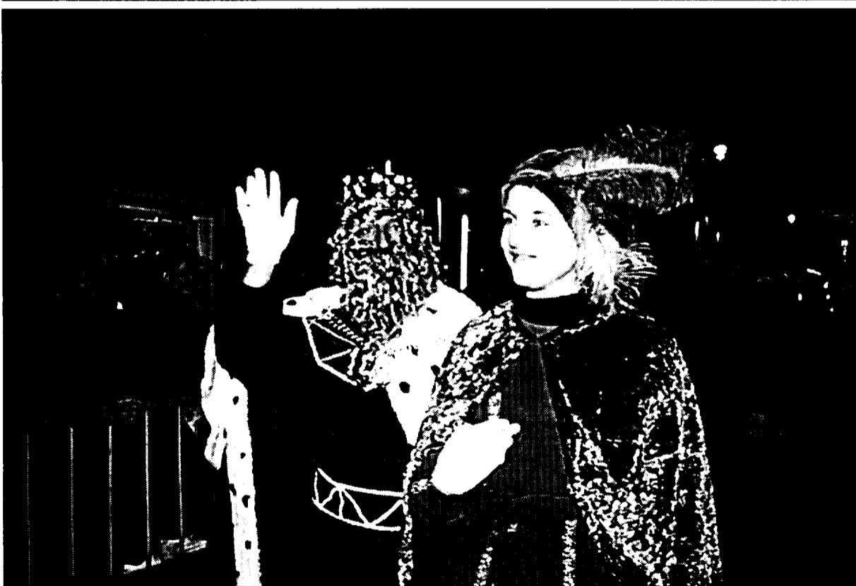
Los Reyes de Oriente despidieron las Navidades.- Las calles de Jaca y Sabiñánigo volvieron a vibrar con la recepción que tuvieron el pasado martes Sus Majestades los Reyes de Oriente. El buen tiempo y la presencia de numeroso público dieron un color especial al final de las Navidades. (Página 5)