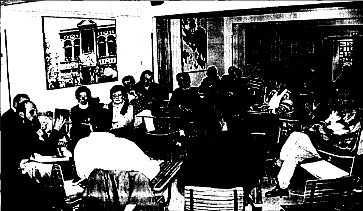
La Plataforma contra el recrecimiento de Yesa se reunió el lunes para ultimar la organización de la marcha

ria el máximo número posible de vecinos de la comarca. La marcha contra el pantano comenzará a las 15,15 horas del sábado; un volteo de campanas será la señal de inicio para este intenso peregrinaje que amenaza en convertirse en la mayor manifestación de cuantas se han organizado hasta la fecha en la Jacetania.