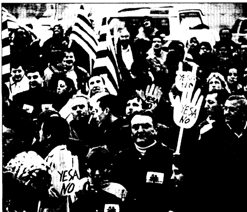
La marcha durante la parada que realizó en Berdún

INSTALACIONES Y MONTAJES ELÉCTRICOS SANTA OROSIA, S.L. Avda. Jacetania, 4 • JACA • Telf. - Fax 974 36 05 05