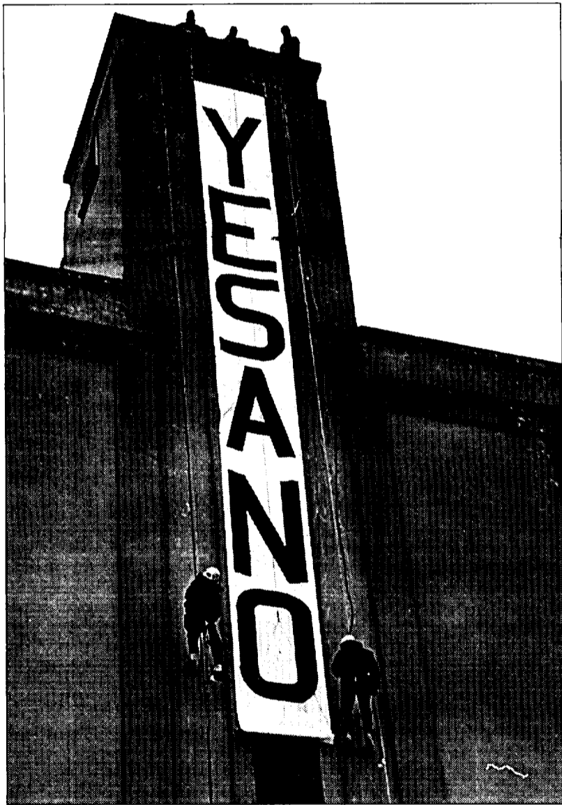
Varios escaladores colgaron el sábado una pancarta en contra del recrecimiento en el silo de Berdún

La licitación de las obras para el recrecimiento de Yesa no podrá hacerse hasta dentro de dos o tres años. La falta del estudio de impacto medioambiental impide que el desarrollo del proyecto pueda realizarse en breve plazo. La dirección general de Obras Hidráulicas y Calidad de las Aguas publicó el pasado 7 de enero en el Boletín Oficial del Estado (BOA) el anuncio del concurso de asistencia técnica para la redacción del estudio de impacto ambiental del recrecimiento de la presa de Yesa y las variantes de las carreteras afectadas.