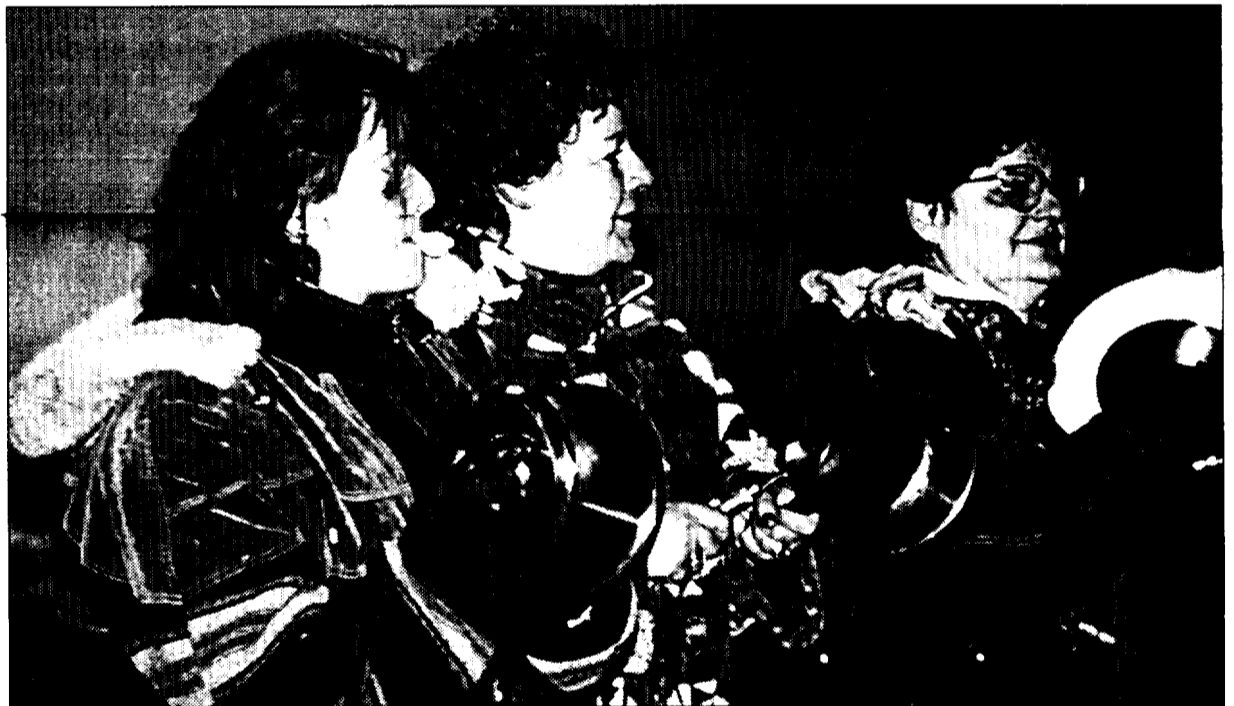
Las mujeres de los trabajadores de Inespal brindaron una madrugadora 'cacerolada' al director de la planta de Inespal en Sabiñánigo

coles podrían concluir hoy con la firma de un preacuerdo. En todo caso, los puntos que se pacten tendrán que ser ratificados después por la asamblea de trabajadores de la planta serralesa.