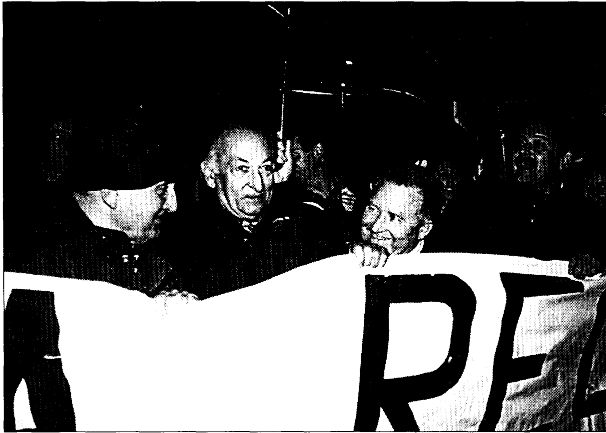
Los alcaldes de Jaca y Sabiñánigo, en los extremos, marcharon al frente de la manifestación con el resto de ediles de las comarcas