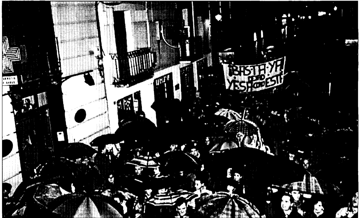
La manifestación a su paso por la calle Mayor en Jaca

hecho, el éxito ha sido total. Esto demuestra la solidaridad que existe en la comarca y que en contra del recrecimiento de Yesa no están unos pocos, como dicen en las Cinco Villas.