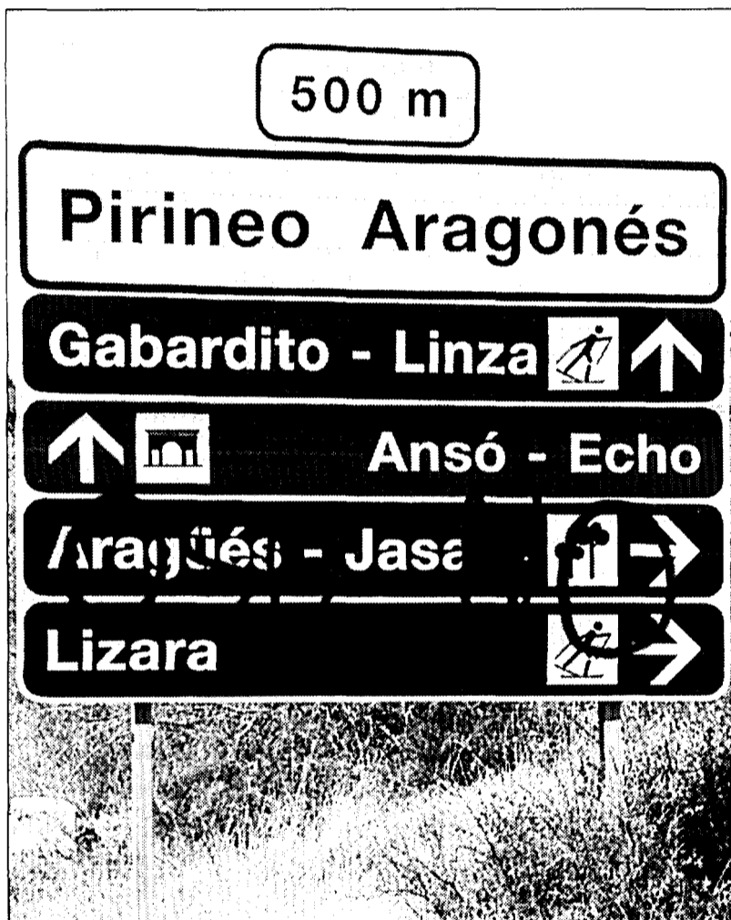
Una de las numerosas pintadas en contra del Plan de Recuperación del Oso en la zona de Los Valles

El departamento de Agricultura y Medio Ambiente del Gobierno de Aragón ha recibido 25 alegaciones al Plan de Recuperación del Oso Pardo, informaron fuentes de esa consejería del Gobierno Autónomo. De ellas, la mayor parte (17) corresponden a propuestas formuladas por particulares, vecinos y empresas privadas, mientras que 6 han sido aportadas por las mancomunidades y ayuntamientos que sufrirían afecciones directas por la aplicación de este plan. Los colectivos ecologistas y proteccionistas han presentado 5 alegaciones y otras 2 provienen de organismos que operan en el vecino departamento francés de los Pirineos Atlánticos, entre los que se encuentra la Oficina Nacional Forestal. Otro de los sectores que han participado en este proceso de consulta son las sociedades de cazadores de las zonas de Los Valles.