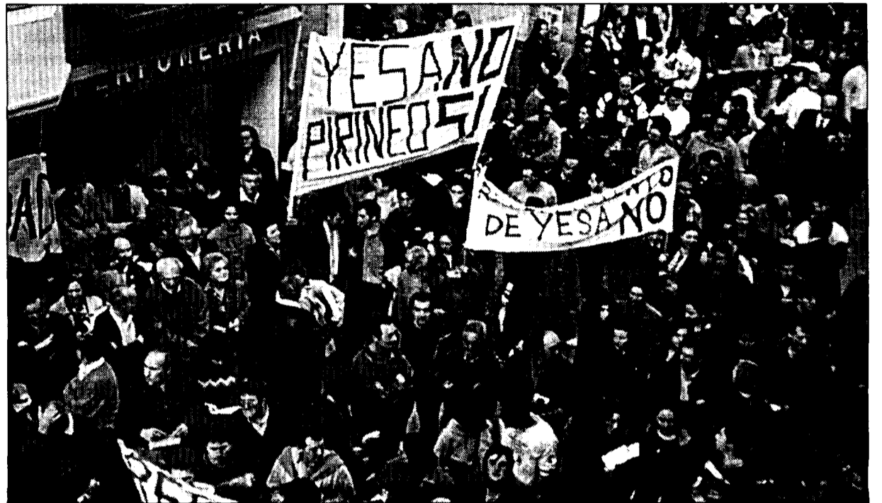
El no a Yesa, de nuevo en la calle.- Cerca de mil personas salieron a la calle el pasado sábado en Jaca para manifestar su rechazo al recrecimiento de Yesa, después de conocer las gestiones realizadas por las administraciones central y autonómica para acelerar el proceso de declaración de impacto ambiental. (Página 3)

El Ayuntamiento de Sabiñánigo tramitará las figuras de planeamiento del cuartel en un año