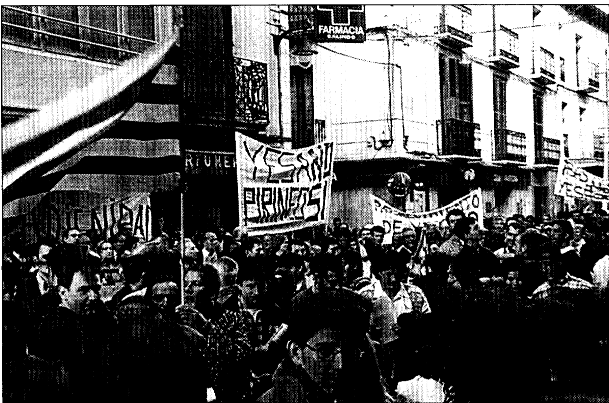
Cerca de mil personas se concentraron el pasado sábado en Jaca para manifestar su rechazo a la declaración de impacto ambiental del recrecimiento de Yesa

centraron el pasado sábado ante la puerta del ayuntamiento de Jaca, en respuesta inmediata y "urgente" al anuncio realizado por Lanzuela coincidiendo con el comienzo de las vacaciones de Semana Santa. Asimismo, la Coordinadora de Afectados por Grandes Embalses y Trasmases (COAGRET) ha denunciado que han existido "presiones" sobre los técnicos del ministerio de Medio Ambiente que han dado el visto bueno a esta declaración de impacto.