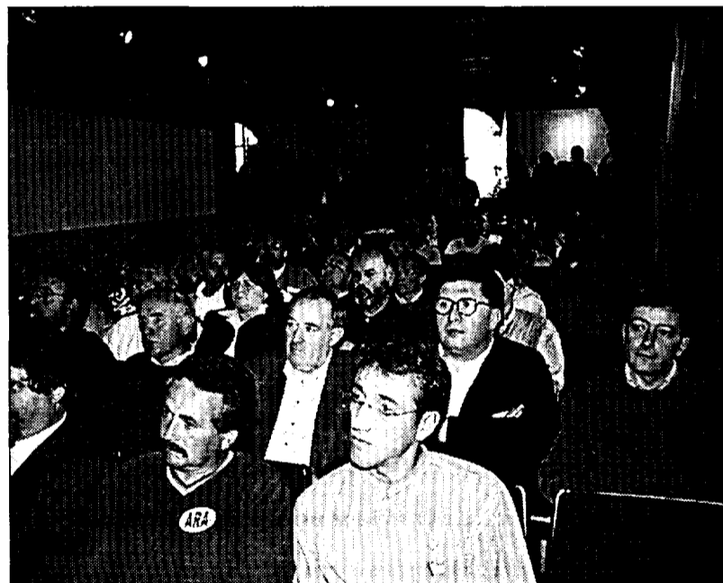
En primer plano, concejales de Jaca, Sabiñánigo y la zona que asistieron a los actos de Boltaña