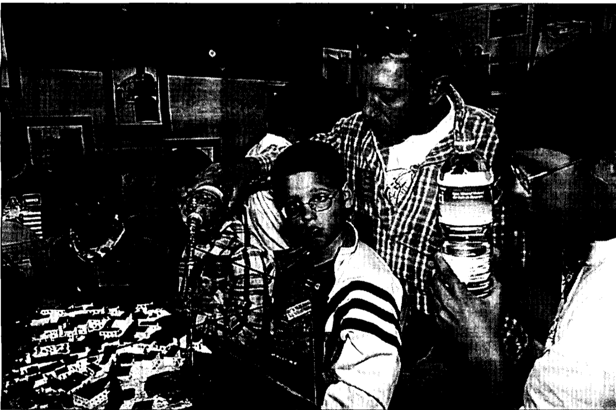
Los vecinos de Sigüés inundaron una maqueta del pueblo hasta la cota de embalsado proyectada con el recrecimiento

Los vecinos de Sigüés y Artieda llegaron a primera hora de la mañana, bien en autobús o en vehículos particulares. Una camiseta con el lema «Yesa no» los identificaba sobre el resto de los participantes en la jornada. A éstos, se les unió, posteriormente, una extensa representación de vecinos de Jaca y las comarcas de la Jacetania y el Alto Gállego que decidieron adherirse a la convocatoria. La organización calculó en unas 3.000 personas las que se congregaron en Boltaña y tomaron parte en los diferentes actos previstos: el festival folclórico con la participación del Grupo Folclórico «Alto Aragón» y grupos de danzantes y palotiaus de Jaca, Embún, Sabinánigo, entre otros, la lectura de un manifiesto por parte del que fuera Justicia de Aragón, Emilio Gastón, y el concierto de grupos musicales en el polideportivo con la Orquesta del Fabiol, José Antonio Labordeta, la Ronda de Boltaña e Ixo Rai. Como muestra de la buena respuesta que tuvo este espectáculo, está el hecho de que a primeras horas de la tarde se hubieran agotado las 2.000 entradas puestas a la venta, con lo que hubo muchas personas que no pudieron acceder al recinto.