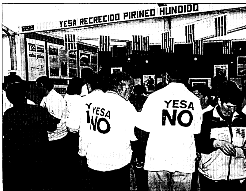
Los vecinos de Sigüés mostraron su rechazo al recrecimiento de Yesa en sus camisetas