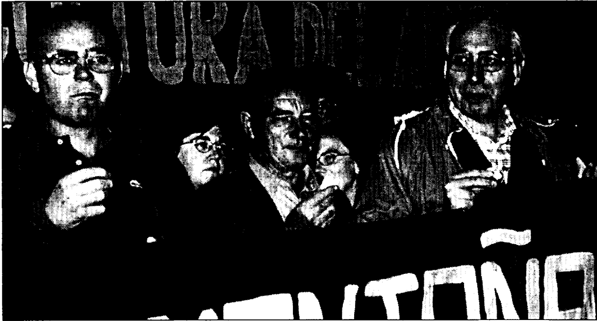
Acto simbólico del pasado 16 de mayo en la catedral de Jaca que significó el arranque del ayuno voluntario

de mayo un ayuno voluntario; ahora, en los días previos a la gran concentración en la capital de la Comunidad Autónoma, son ya más de 1.300 los que han firmado el compromiso de participar en el ayuno simbólico de este sábado. De ellos, más de 400 son de la comarca de la Jacetania, una cifra que sobrepasa con creces la prevista en un principio por los convocantes, en torno a los 100.