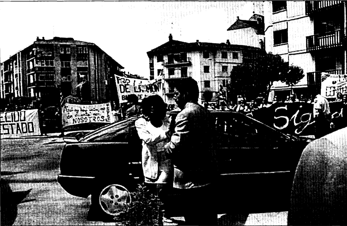
Isabel Tocino rodeada de pancartas, en su llegada al Palacio de Congresos de Jaca

La llegada de la ministra al Palacio de Congresos de Jaca se produjo en medio de una sonora pitada y rodeada de pancartas alusivas al recrecimiento de Yesa y a la construcción de los embalses de Biscarrués, Jánovas y Santa Liestra. Unas 250 personas, venidas desde las distintas poblaciones afectadas, además de Jaca, manifestaron a Isabel Tocino el malestar existente en la montaña por la política hidráulica que se está impulsando desde las administraciones del Estado.