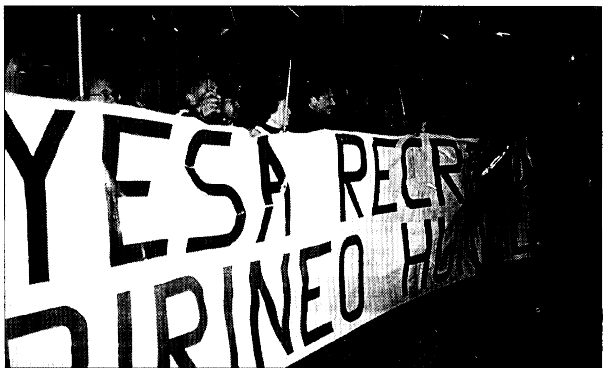
La manifestación de los paraguas de Jaca congregó el pasado año a más de 5.000 personas

En el manifiesto se expone que las manifestaciones que se han desarrollado hasta la fecha en la Jacetania y en otros puntos del Pirineo y de Aragón, "no pueden ser ignoradas por más tiempo", y se pide al presidente del Gobierno autónomo, Marcelino Iglesias, que "ponga todos los medios" para establecer nuevos foros de diálogo que impidan que siga aumentando el conflicto social que está generándose entre las comarcas del llano y de la montaña. Tras cuestionar la política de "hechos consumados" que esta siguiendo en este proceso el Ministerio de Medio Ambiente, a través de la empresa Acesa y la Confederación Hidrográfica del Ebro (CHE), los firmantes del manifiesto animarán al presidente Iglesias a que "defienda con valentía sus nuevos