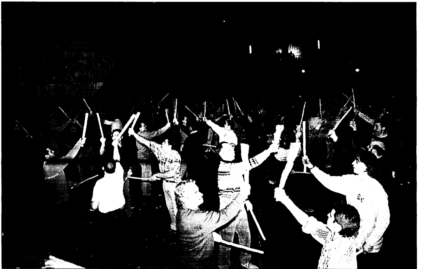
44 danzantes, 8 sobre el escenario, 36 en la pista, enmudecieron con el trucar de sus palos al público que asistió al concierto del polideportivo de Jaca

La Asociación «Río Aragón» contra el recrecimiento de Yesa ha calificado de "rotundo éxito" los actos programados el sábado. La jornada de aniversario de la manifestación del 9 de enero de 1999 comenzó con la firma de un manifiesto por parte de los ayuntamientos y mancomunidades de la Jacetania, además del de Sabiánigo y la Asociación de Entidades Locales del Pirineo Aragónés (ADELPA). En