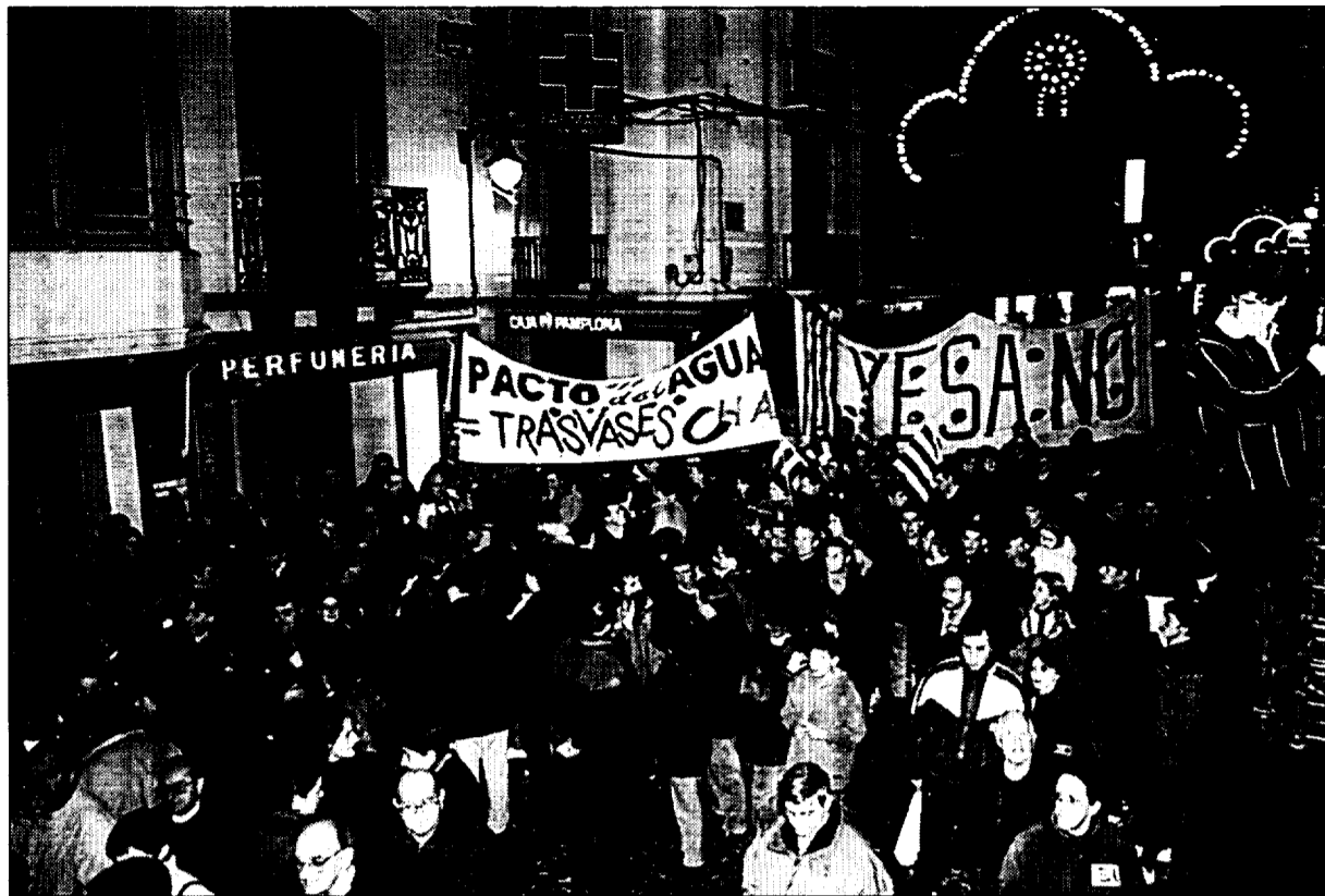
La concentración ciudadana frente a la casa consistorial contó con la presencia de unas ochocientas personas

La Asociación ha anunciado también que si la administración no es capaz ahora de afrontar el problema de Yesa "con valentía y respeto hacia nuestros legítimos derechos, nosotros sí sabremos cómo demostrar nuestra inquebrantable oposición al proyecto de recrecimiento de Yesa".