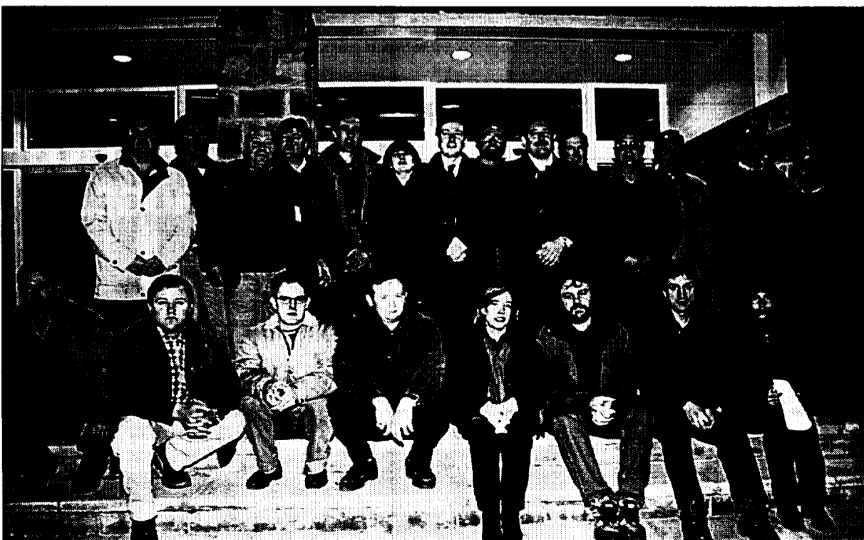
Grupo de alcaldes y presidentes de mancomunidades que firmaron el manifiesto en el Palacio de Congresos