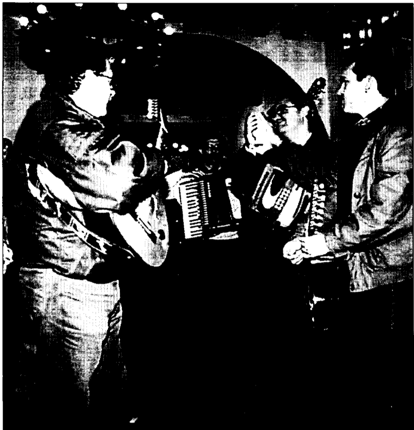
La Ronda de Boltaña cantó la «Habanera triste» en el pórtico del ayuntamiento de Jaca