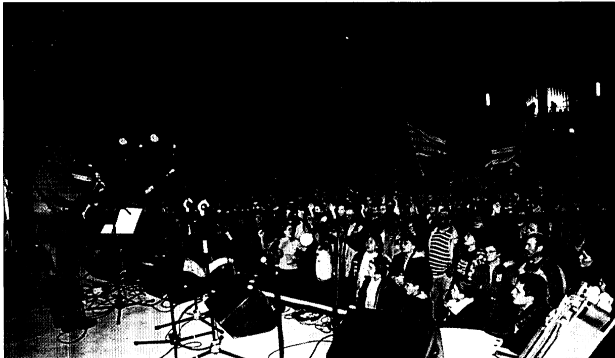
José Antonio Labordeta abrió el multitudinario concierto en contra del recrecimiento de Yesa