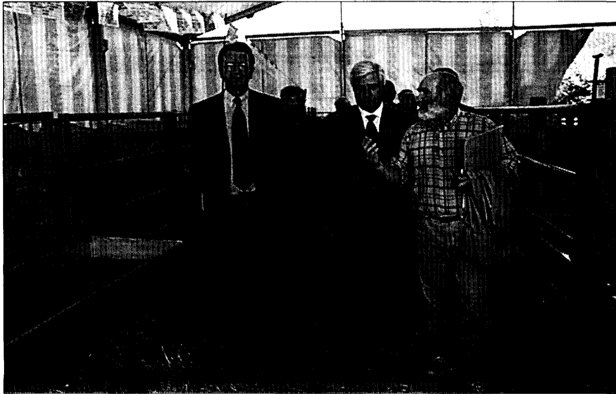
El Consejero visitó con detenimiento el recinto ferial ganadero