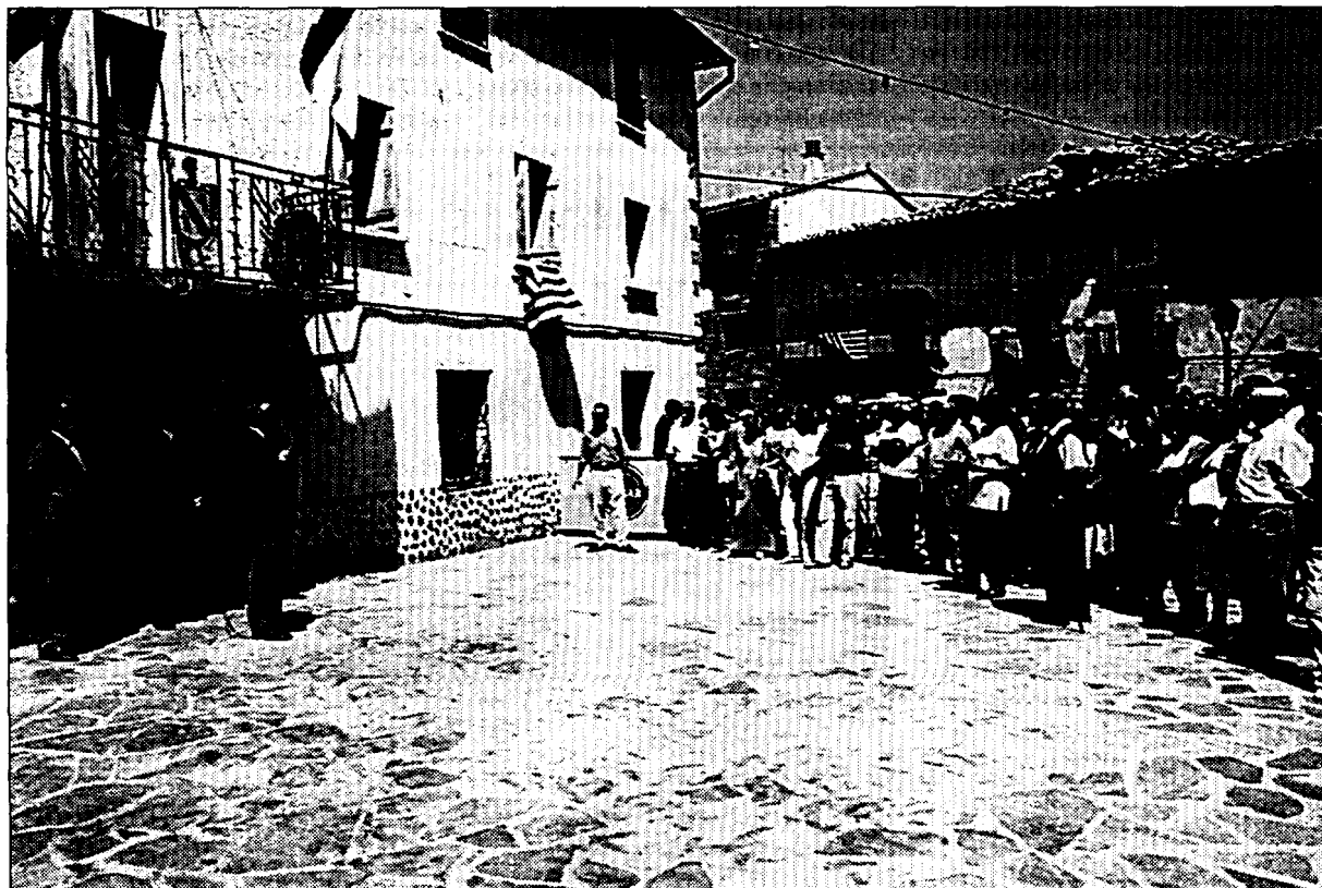
Biel animó a la Jacetania a concluir el proceso de comarcalización en los próximos meses

La Asociación montó una mesa de recogida de firmas durante todo el día, explicó a los vecinos todos aquellos aspectos relacionados con el recrecimiento de Yesa, y expresó su malestar por la falta de contenido de las intervenciones de los políticos respecto a esta situación. Señalaron que en una jornada reivindicativa como esta, además del proceso comarcalizador, tenían que haberse puesto de manifiesto otras realidades que limitan e impiden el desarrollo de la Jacetania, entre ellas la amenaza de Yesa.