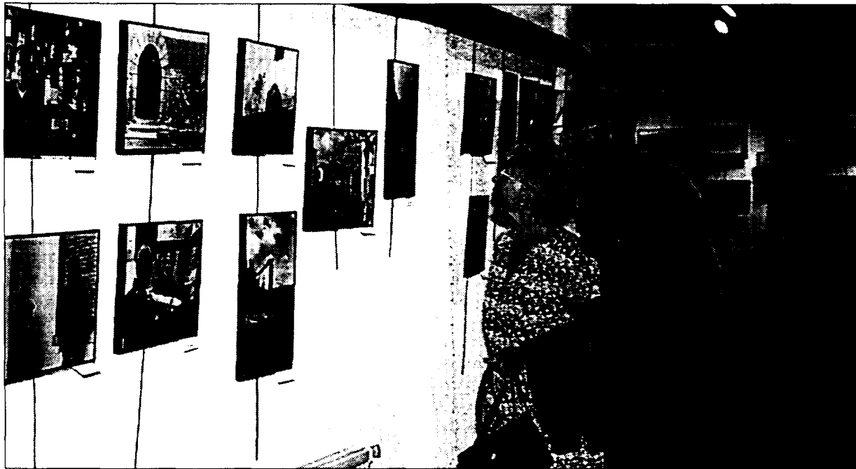
Presente y pasado se han conjugado en la exposición sobre el pantano de Yesa

E.P.A.- Las Jornadas contra el recrecimiento de Yesa, organizadas por la Asociación «Río Aragón», han coincidido con el momento más ‘caliente’ del año en cuanto a política hidráulica en España. El anuncio del Gobierno central de acometer el trasvase de 1.000 hectómetros cúbicos anuales del Ebro a cuencas de Cataluña, Valencia, Murcia y Andalucía, ha puesto en alerta al Gobierno de Aragón, que ya ha anunciado su oposición “con todos los medios democráticos a su alcance al Plan Hidrológico Nacional, si éste contiene trasvases del Ebro a otras cuencas”. El ejecutivo aragonés ha manifestado que los trasvases “no se pueden justificar en la solidaridad internacional, puesto que no es solidario ni progresista dar más a quienes más tienen y, en este caso, los mil hectómetros cúbicos que se pretenden extraer del Ebro aumentarán las desigualdades entre Comunidades”.