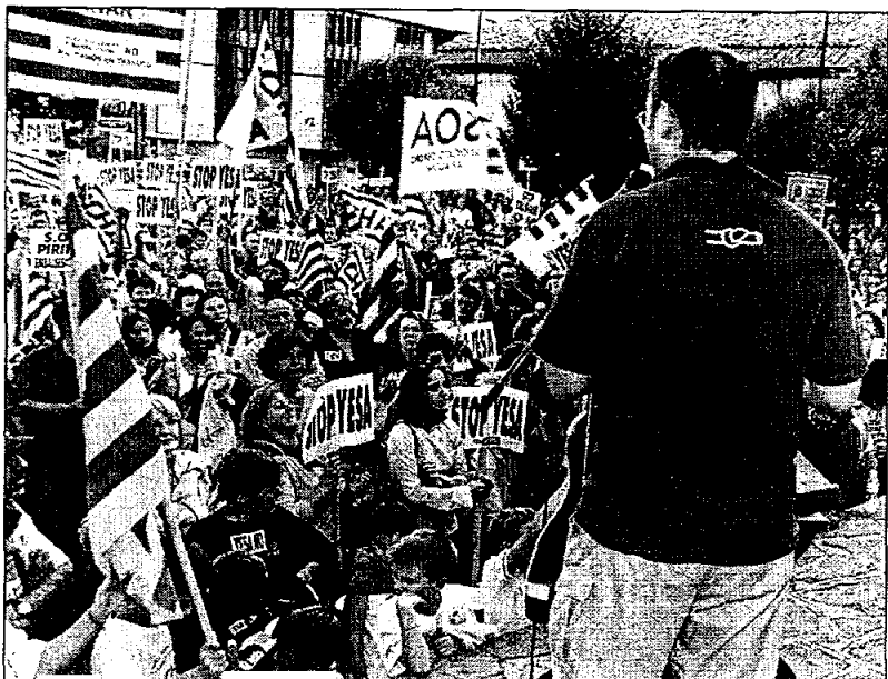
La Asociación «Río Aragón» fue uno de los convocantes de la Marcha Azul, el pasado verano