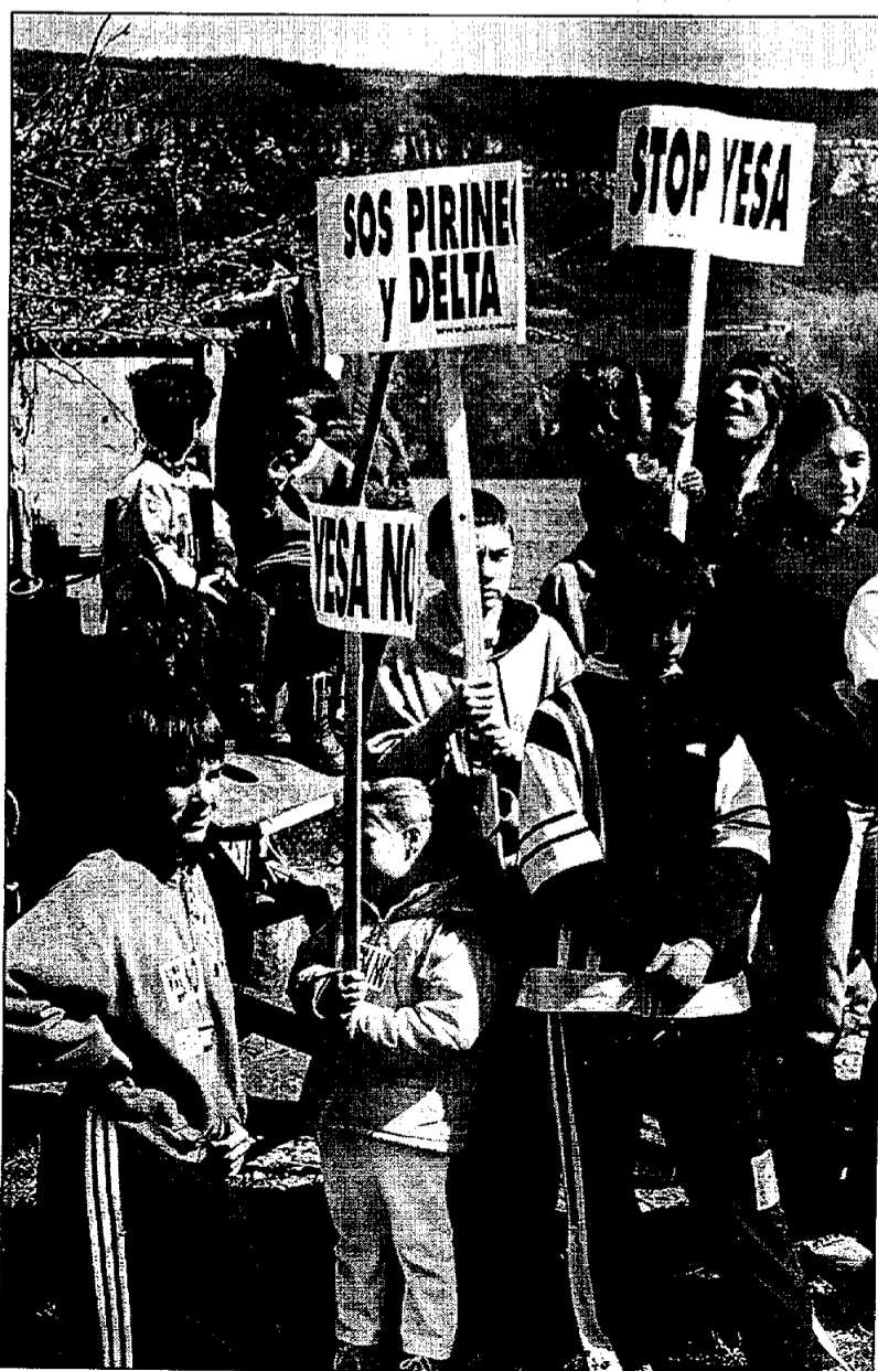
Niños de Artieda y de la Jacetania en la concentración de las Huertas de Artieda